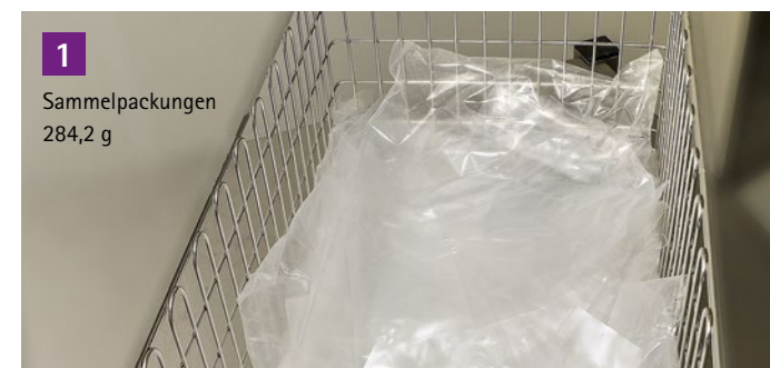
1 Sammelpackungen 284,2 g

Die während des ADKA-Kongresses 2018 als Poster veröffentlichten Daten von Gärtner et al. belegen, dass der Einsatz von Sammelpackungen in der Arzneimittelherstellung sowohl zeitsparend als auch umweltschonend ist. Trotz höherer Materialkosten erweist sich die Verwendung von Sammelpackungen durch die Reduktion der Partikellast sowie verringerte mikrobiologische Kontaminationsmöglichkeiten als vorteilhaft. Dies schafft eine effiziente und ressourcenschonende Zubereitung – zum Wohle der Patienten, der Anwender und der Umwelt.