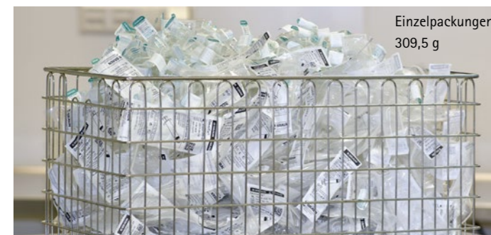
Einzelpackungen 309,5 g